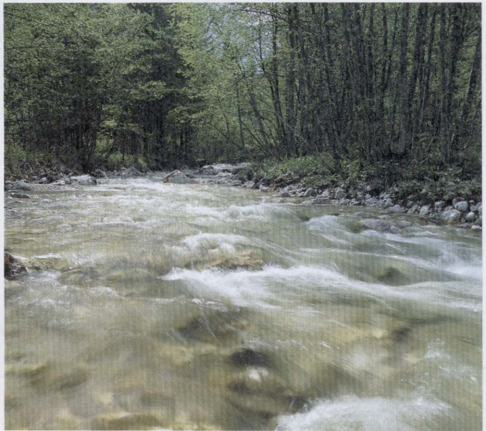
Lebensraum für Schwarzstörche: Schluchtwald und unberührte Bachläufe