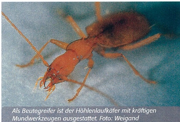
Als Beutegreifer ist der Höhlenlaufkäfer mit kräftigen Mundwerkzeugen ausgestattet.