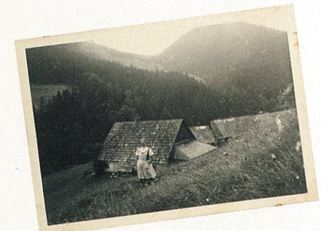
Titelbild: Die Resi von der Puglalm in jungen Jahren...

Puglalm, Laussabaueralm, Almstube Karlhütte, Egglalm